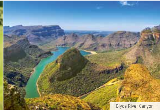
Blyde River Canyon